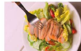
케이준 치킨 샐러드 Cajun Chicken Salad ₩5,000