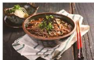
냉메밀 소바 Cold Buckwheat Soba ₩6,000