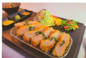
등심카츠 Loin katsu ₩8,000