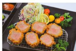
안심카츠 Tenderloin katsu ₩8,000