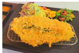
왕 돈가스 Pork Cutlet ₩6,500