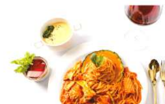
로제 파스타 Rosé pasta ₩7,000