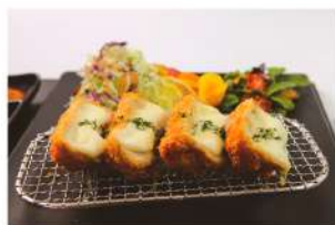
치즈카츠 Cheese katsu ₩8,000