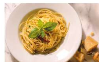
알리오 올리오 Spaghetti aglio e olio ₩6,000