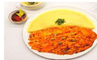
베이컨 김치 오므라이스 Bacon kimchi omurice. ₩7,000